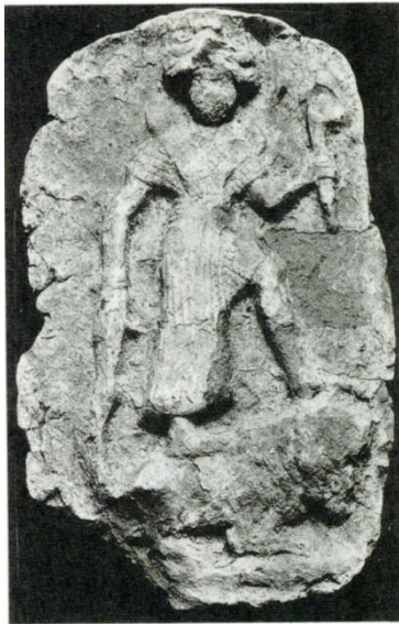
Gewapende Inanna, terracotta reliëf, begin tweede millennium. (Barrelet, 1968, fig. 792, pl. LXXVIII; Louvre, AO 6502)