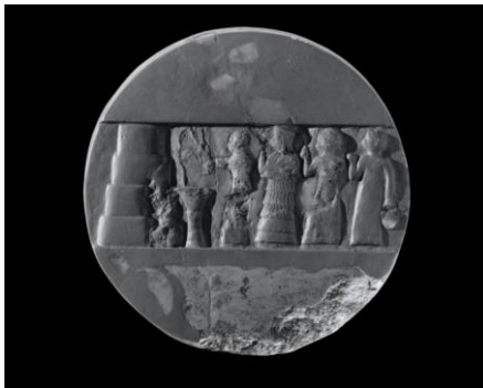
Gerestaureerde schijf van kalksteen van Enheduanna van Ur. Diameter: 26 cm. (Met dank aan: © Penn Museum, Pennsylvania, Verenigde Staten, 139330/B16665)