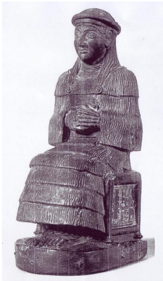
Beeldje van Enanatum, En-priesteres in Ur. Ca. 1953 v.C. Hoogte: 24 cm.