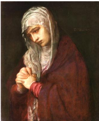
(Titiaan, Mater Dolorosa , 1555.)