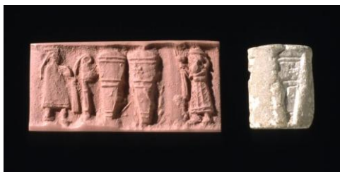
Uruk. Hoogte: 4,7 cm, diameter: 3,8 cm. (© The Trustees of the British Museum, BM 116721)

Rolzegel met een priesteres op een 'troon' voor de tempel. Voor haar schenkt een tempeldienaar (of de man in zijn netrok?) een vloeistof uit in een beker. In het veld zit een figuur achter een rij potten. (Louvre, A.117)