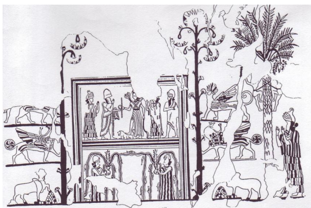
Fresco in het paleis van Mari. Ištar reikt de ring en staf uit aan de koning van Mari, vermoedelijk Zimri-Lim, ca. 1800 v.C. Overal bloeit de natuur op en vruchtbaarheid schenkend water borrelt omhoog uit de vazen. De godin staat met één voet op een leeuw, het teken van haar macht. (Keel, 1992, afb. 119)