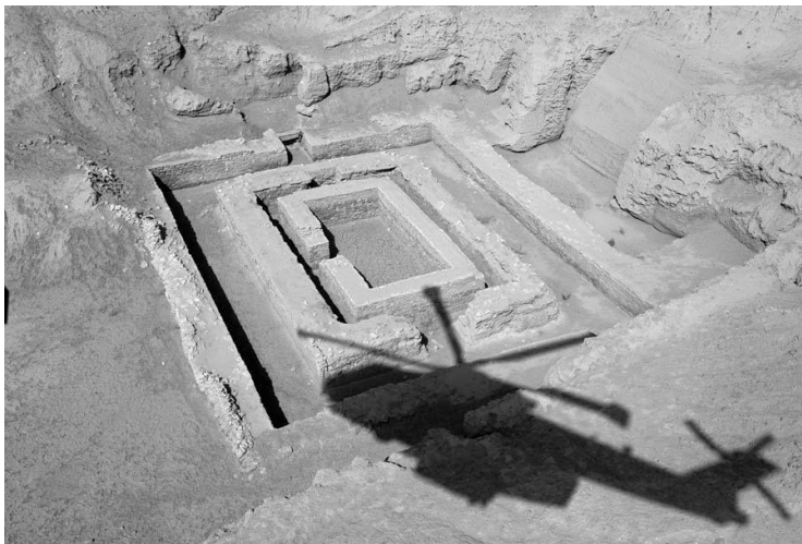
De stenen tempel met de schaduw van de helikopter van het inspectie team